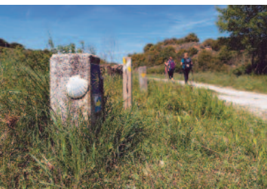
Raúl Gárate "A camino largo, paso corto"