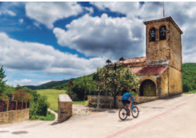
Nuria Castellanos "Camina salud"