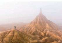
«Niebla en Bardenas Reales». J.C. Comerón.

«NAFARROA EZAGUTU XVII. ARGAZKI-LEHIAKETA». 2024KO FINALISTAK