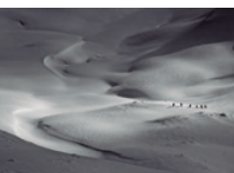
«Sombras y luces». Javier Camacho.

Lekua: Vallesantoro Jauregia/Kultur Etxeko behealdeko solairuko Erakusketa Aretoa.